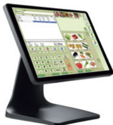
Mod.ZQT8356 para Windows