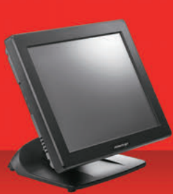
PS-3315E & PS-3316E (16:9)

Tecnología Fanless, sin ventiladores. Menor consumo y mayor vida útil. Desde 8,1" hasta 17". Panel táctil tipo Flat sin bordes (opcional)