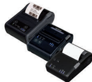
TM-P20/60/80 Gama portátil 60-80 mm Wifi o Bluetooth