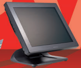
XT-5315 Procesadores i3