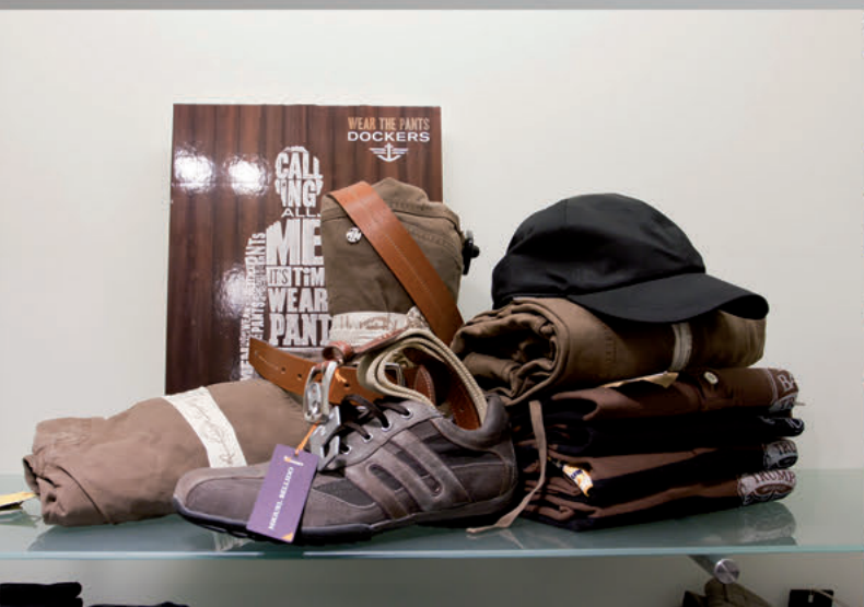
TALLA Y COLOR