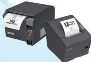
TM-T70-i / TM-T88-i Gama Intelligent