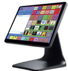
Mod.ZQA8356 con Android